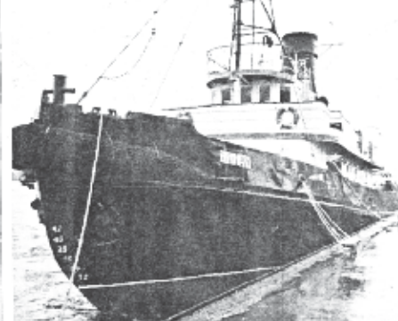
Liegt bis zum 21. Mai im Museumshafen Neumühlen; die Admiral. Der Dampfschlepper kann täglich von 11 bis 22 Uhr besichtigt werden.